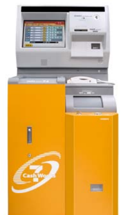
両替機（釣銭交換機）