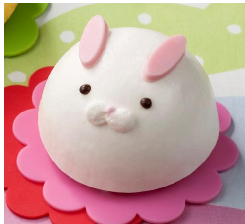
『うさぎのムースケーキ』 328円