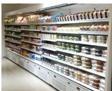
店内オープンケース