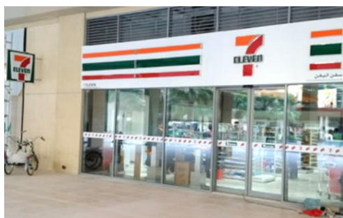
ベイスクエア店（1号店）店舗外観