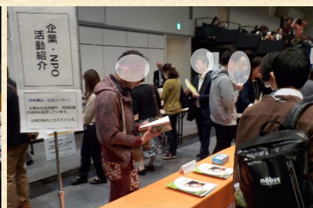
企業・NPO活動紹介コーナー