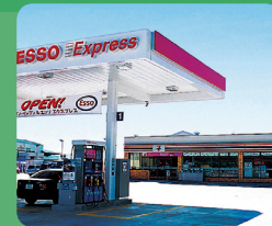
ガソリンスタンドと併設での出店