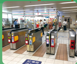
駅構内やホームへの出店