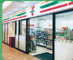
大型ビル内への出店