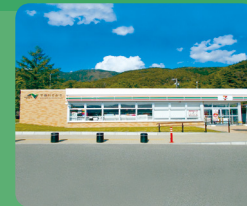
高速道路SA/PAへの出店