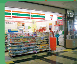
官公庁内への出店