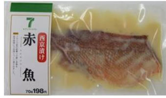
赤魚西京漬け ＜価格＞ 198円（税込）