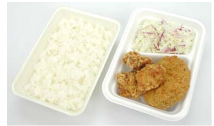
商品名 : 唐揚げ&メンチカツ弁当 価 格 : 478円（税込）