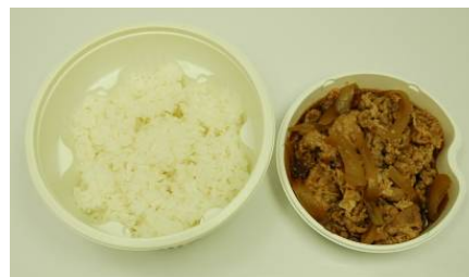
商品名 : つゆだく牛丼 価 格 : 380円(税込)