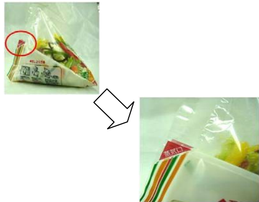
<パッケージと蒸気穴>