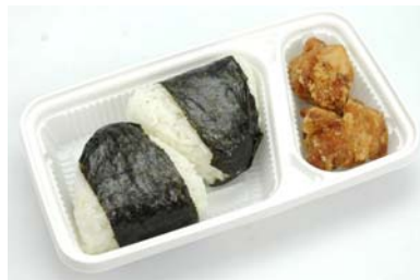
商品名 : お店で揚げた唐揚げとおにぎり 価 格 : 250円（税込）