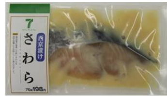
さわら西京漬け ＜価格＞ 198円（税込）