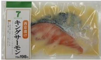
キングサーモン西京漬け ＜価格＞ 198円（税込）