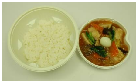
商品名 : 五目中華丼 価 格 : 398円(税込)