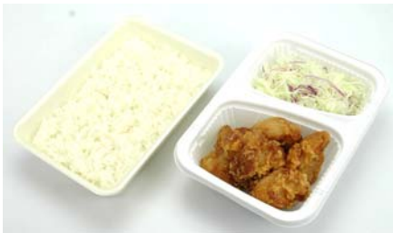
商品名 : 唐揚げ弁当 価 格 : 450円（税込）