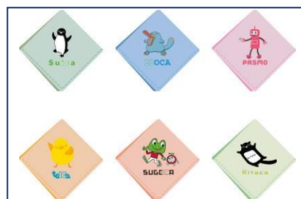
B コース ハンカチセット（イメージ）