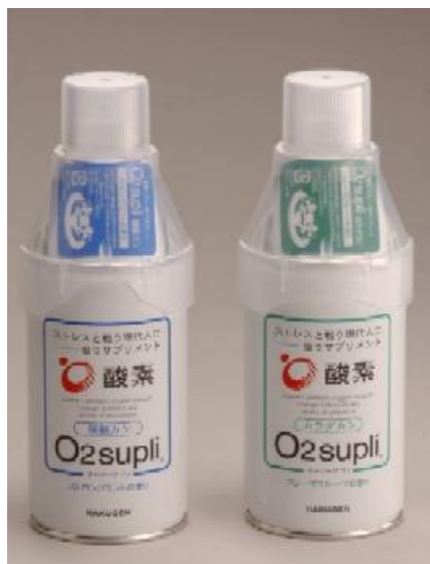
左)「オーツ-サプリ 頭脳カン」(税込 600 円) 右)「オーツ-サプリ カラダカン」(税込 600 円)