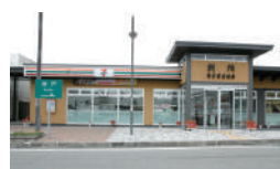
姫路バイパス別所 PA 上り・下り店様