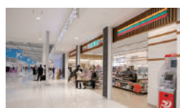
関西国際空港 第2ターミナル店様