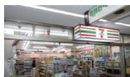
パレスサイドビル店様