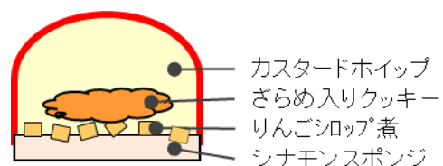
商品名『カスタードホイップとリンゴのケーキ』 価格 328 円