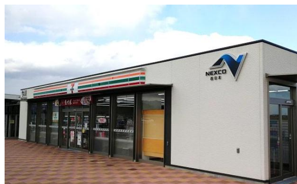
店舗イメージ(既存の「今川 PA 下り店」外観)