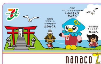
八戸市 nanaco カード