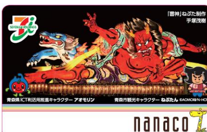
青森市 nanaco カード