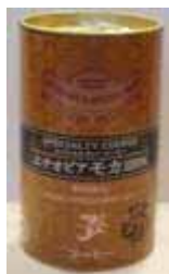
エチオピアモカ 155 g 缶