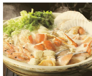
佐藤水産 北のかに鍋セット 8,000円