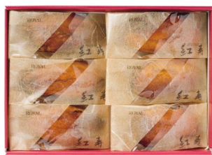
ロイヤル 紅寿 3,000円