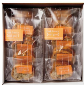
シベール アールグレイラスク 2,665円