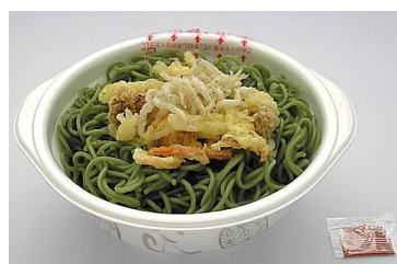
網走湖産白魚のかき揚げ蕎麦