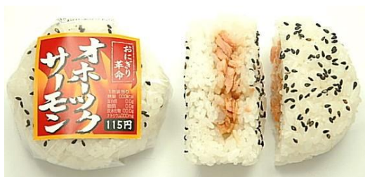
ゴマおむすびオホーツクサーモン