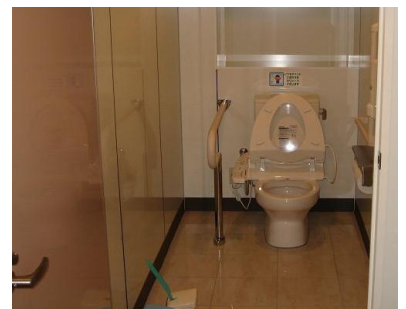
「広く手すりが付いたトイレ」