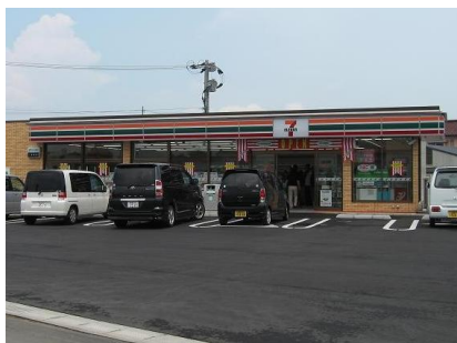
「なだらかなこう配の出入口」

※ 2007 年 11 月末現在：出入口自動ドア＝3,876 店舗、通路拡張＝2,106 店舗、 トイレスペース拡張（手すり設置）＝5,377 店舗