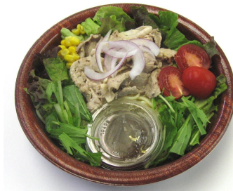
「キングポークと トマトのパスタサラダ」 395 円