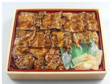
「キングポークの 炭火炙り焼肉重」 580 円