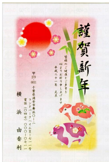
＜「生活応援カラフル絵柄」の一例＞