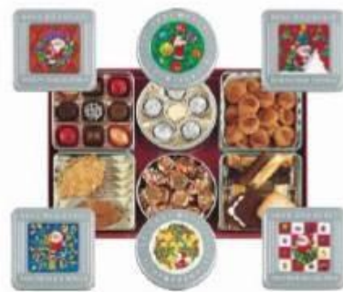
モロゾフ クリスマスサプライズ 3,465円