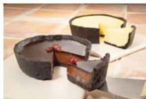
<北海道・岩見沢の 人気店>