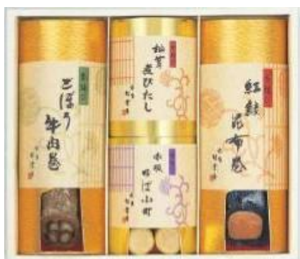
赤坂 松葉屋 冬の季結び 3,465円