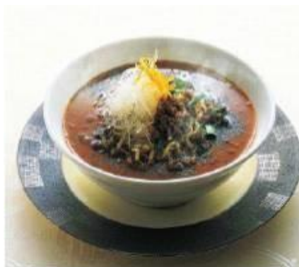
紅虎餃子房 黒胡麻坦々麺 3,990円