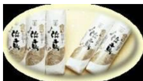
<山口県との地域活性化 包括連携協定を活かした 新商品>