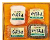
日本ハム 吟撰美味ハムギフト 3,000 円