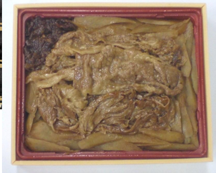
「飛騨牛の牛めし（大）」