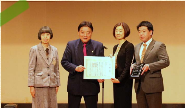
名古屋市 河村市長より表彰状と楯を 授与していただきました