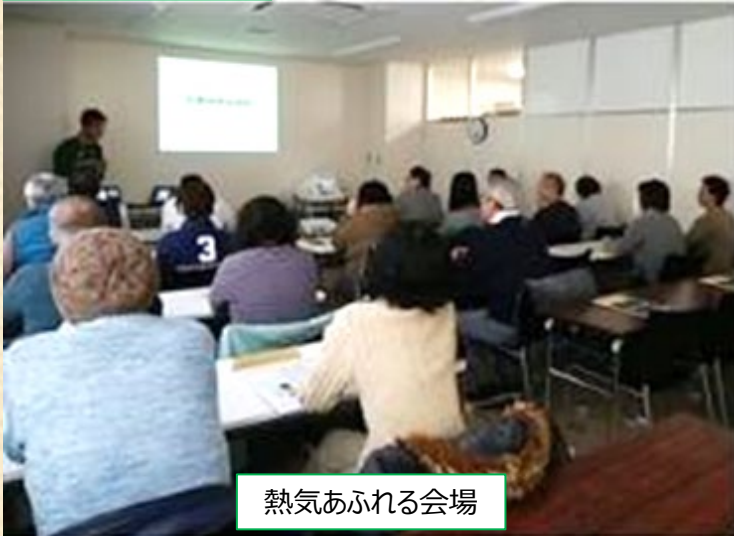
熱気あふれる会場