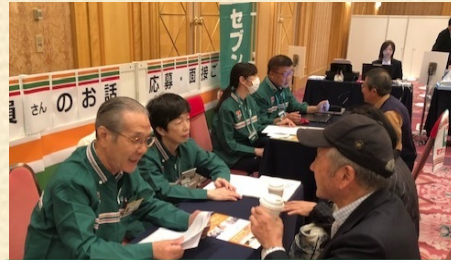
現役シニア従業員による説明会

行政や公的機関と連携して、シニアの方をはじめ多様な人財にご活躍いただけるように貢献してまいります