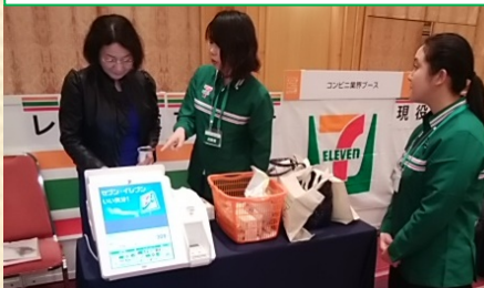
レジ打ち体験は好評