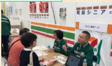
現役シニア従業員による説明会