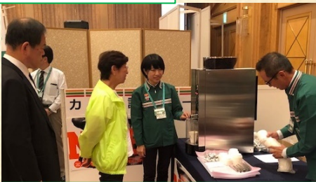
カフェ試飲コーナー200名来場