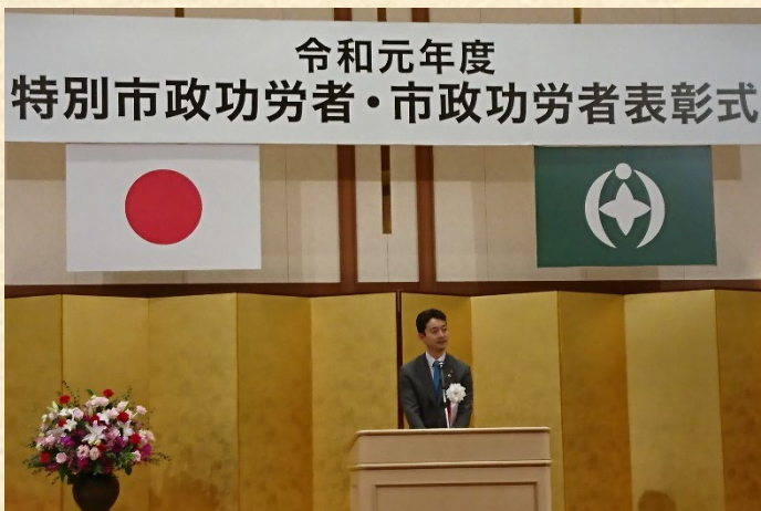
千葉市熊谷市長ご挨拶