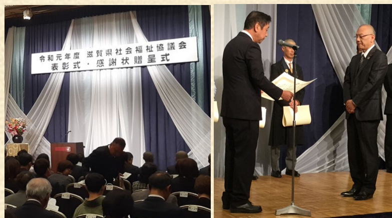
表彰式・感謝状贈呈式