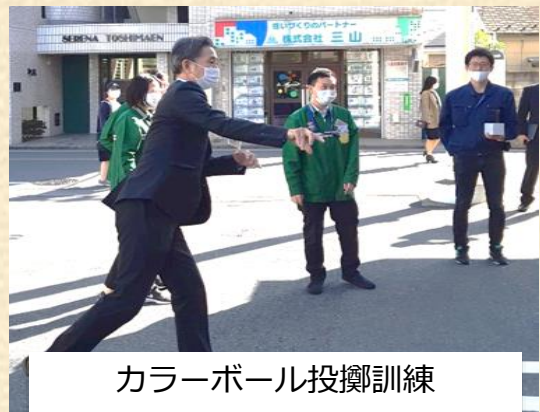
カラーボール投擲訓練