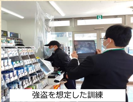
強盗を想定した訓練

内要： セブン-イレブン練馬春日町1丁目店で防犯訓練を行い、周辺店舗にリモートでご参加いただくことで地域で一体となって取り組む。