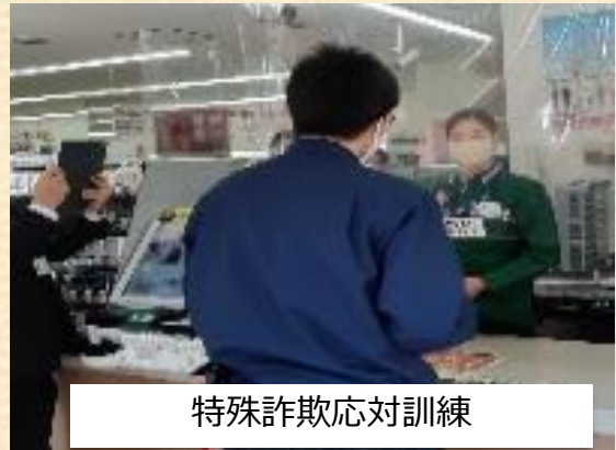
特殊詐欺対応訓練