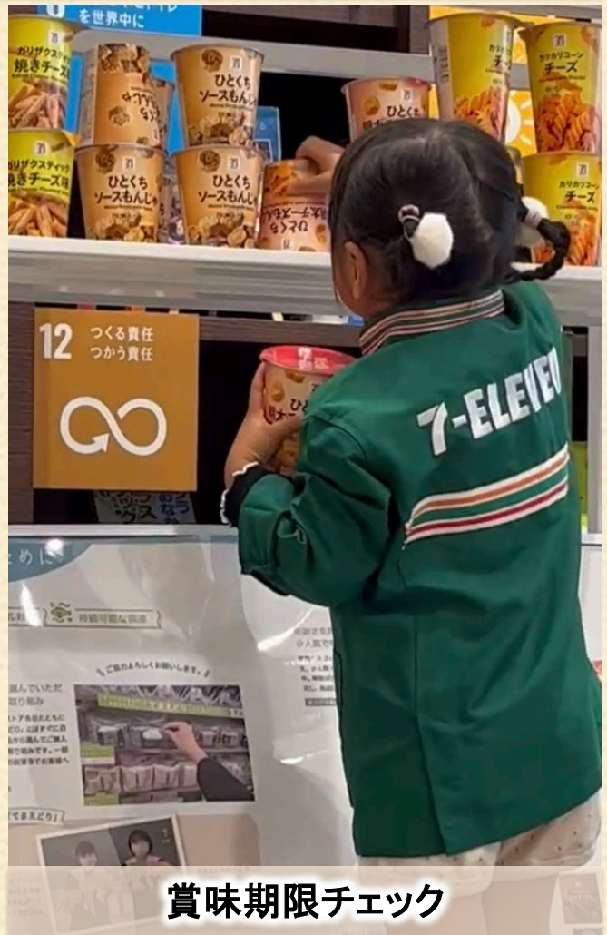
賞味期限チェック