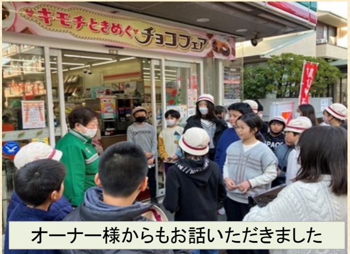
オーナー様からもお話いただきました