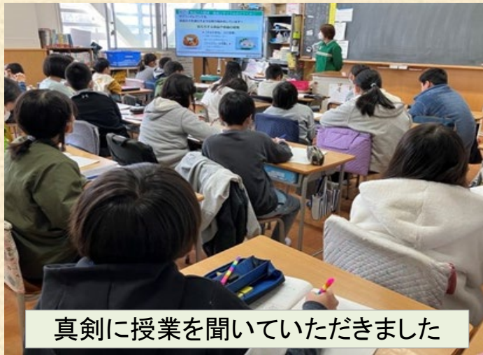
真剣に授業を聞いていただきました

セブン-イレブン・ジャパン(以下:セブン-イレブン)は川崎市立平間小学校で「食品ロス削減とペットボトル循環」を中心にした出張授業を行いました。身近に出来るSDGsとして「てまえどり」のPOPを児童の皆さんで作成し、学区内2店舗ご協力のもと売場に掲示しております。セブン-イレブンは、今後も学校や行政、地域社会との連携を深め、キャリア教育の支援をはじめ、SDGsの取り組みをさらに推進して参ります。