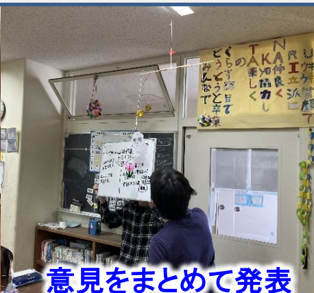
意見をまとめて発表