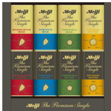
商品の中身（イメージ）