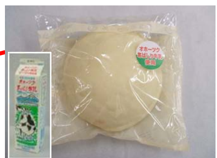
あばしり牛乳の白いメロンパン （北見地区にて発売）