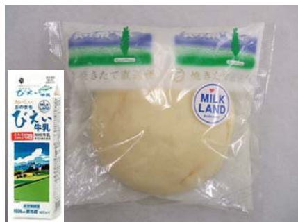
丘のまちびえい牛乳の白いメロンパン （札幌・苫小牧地区にて発売） ※旭川地区は 4/14 発売済