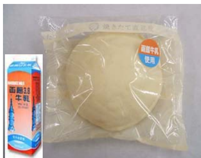
函館牛乳の白いメロンパン （函館地区にて発売）