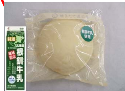
根釧牛乳の白いメロンパン （釧路地区にて発売）