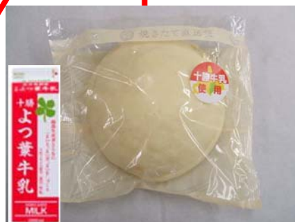
十勝牛乳の白いメロンパン （帯広地区にて発売）