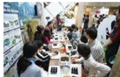
セブンファーム 昨年の種まきワークショップの様子 (2009 年エコプロ会場)

試験的にオリジナル商品『セブンプレミアム』の一部商品の CO2 量の構成をわかりやすいイラストを用いてご紹介。