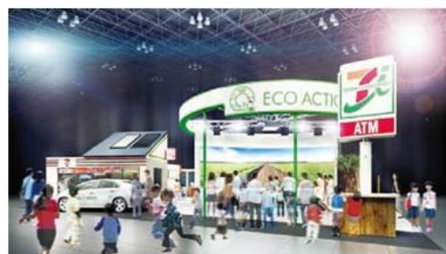
出展ブースイメージ（東京ビッグサイト 東 2 ホール）