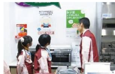
昨年の子ども店長体験の様子 （2009 年エコプロ会場）