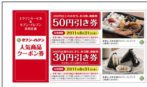
[セブン-イレブン 人気商品クーポン券(非レシートタイプ)]