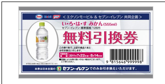
[セブン-イレブン ソフトドリンク無料引換券(写真は商品の一例)]