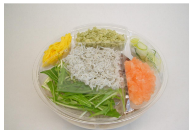
『久慈浜しらすのおろし蕎麦』 395 円

○製法にこだわった「久慈浜しらす」を使用し、野菜、揚げ玉、錦糸玉子の、彩りよい、さっぱり味の蕎麦です