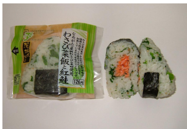
『わさび菜飯と紅鮭のおむすび』 126 円