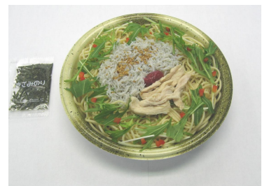
『久慈浜しらすの和風スパゲティ』 395 円

○製法にこだわった「久慈浜しらす」を使用し、野菜、揚げ玉、錦糸玉子の、彩りよい、さっぱり味の蕎麦です