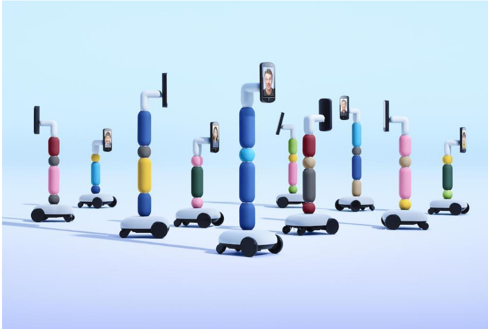
図 3 newme のイメージ