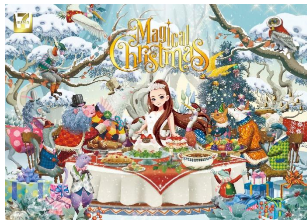
②「セブン-イレブン限定クリスマスカード」