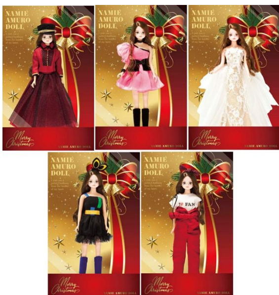
①「NAMIE AMURO DOLL」ラインアップ