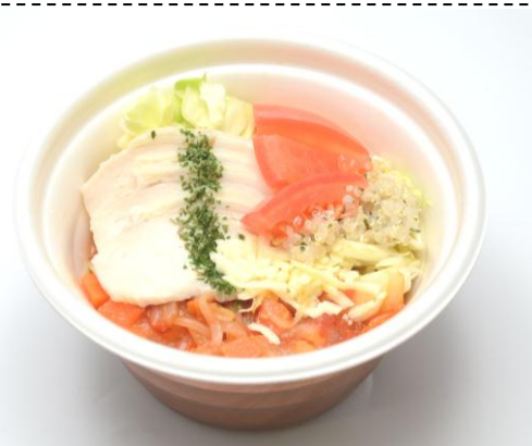
『野菜を食べよう！ 蒸し鶏とトマトのスープ』

価 格：341 円（税込 368 円） 発 売 日：4 月 17 日（火）以降順次 販売エリア：全 国 特 長：