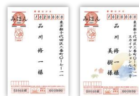
※宛名印刷イメージ