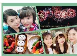
シャッフルプリント(2L サイズ)