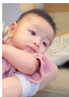
写真 2L サイズ