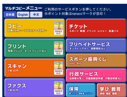
現行マルチコピー機操作画面

マルチコピー機を初めてお使いいただく方でも迷わずに操作ができるよう、従来の操作画面を見直し、スマートフォンやタブレット端末と近いデザインに刷新しました。また、本体の高さを低くし、操作画面の角度を最適化するなど、車いすの方でも「あんしん」してご利用いただけるデザインに変更しました。