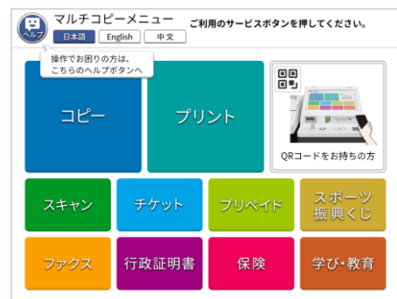
新マルチコピー機操作画面