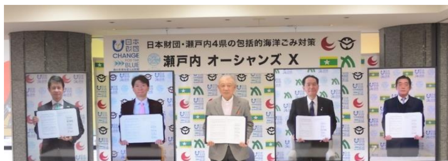
広島県 湯崎知事 岡山県 伊原木知事 日本財団 笹川会長 香川県 浜田知事 愛媛県 中村知事

<目標> ごみの流入 70%減、回収 10%以上増（5カ年・計 15 億円計画）