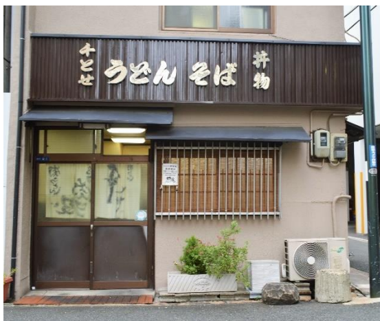
▲『千とせ本店』の店頭写真

元来「肉うどん」を販売してきましたが、吉本芸人が店を訪れた際、二日酔いのために軽く食事を済ませようと「肉うどん、うどん抜きで」と注文したところ、先代の店主がそれに応えたことから「肉吸い」の販売が始まりました。その後クチコミで世間に広まり、今では店一番の人気メニューとなっています。