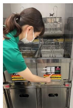
揚げ物調理機未使用時の「セーブモード」の設定