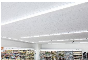
店内照明のLED化と 配灯見直し