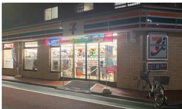
店頭看板のライトダウンの様子

平素は当店をご利用いただきありがとうございます。 電力供給がひっ迫する中、節電に協力するため、店頭・店内の照明を一部消灯をして営業している場合がございます。 お買い上げ物中のお客様には大変ご不便をおかけいたしますが、何卒ご理解・ご協力の程よろしくお願いいたします。 セブン・イレブン店主