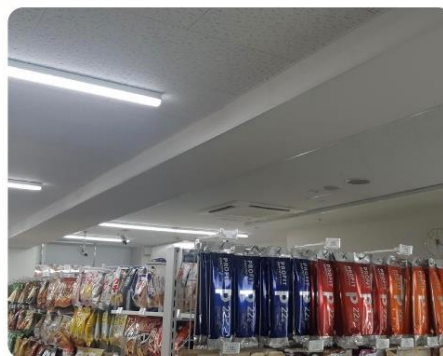
店内照明を落とした売場