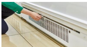
「スライドクリーンフィルター」搭載