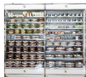
チルドケースエアカーテンの 性能向上