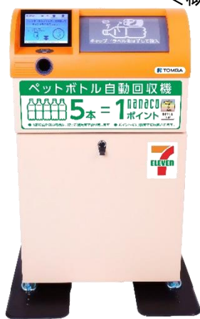
トムラ・ジャパン（株）製