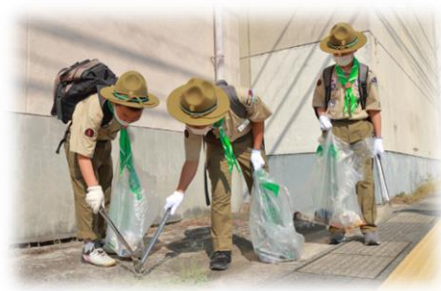
▲「スカウトの日」における 環境美化活動の様子

1994 年度～2021 年度までの 「スカウトの日」活動結果 累計参加人数：1,328,974 人 空き缶・ペットボトル回収 累計数：8,096,101 本