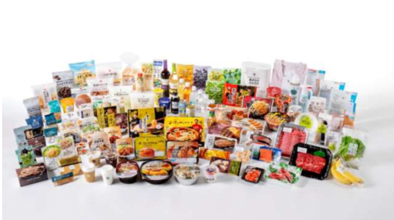
(セブンプレミアム商品一例)

『セブンプレミアム』は今後も、安全・安心で健康や環境にも配慮した商品開発に取り組み、お客様に「こんなのほしかった」と喜んでいただける商品を提供し続けることで、さらなる成長を目指してまいります。