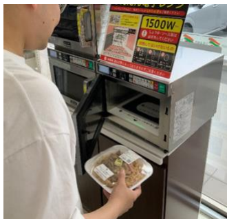
お客様がセルフでレンジ加熱を行う店舗