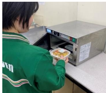
店舗従業員がレンジ加熱を行う店舗